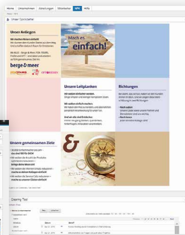
Berge & Meer XCC Themenseite

das Intranet. Die Entscheidung für XCC bestätigt sich dabei immer wieder: Anpassungen erfordern nur wenige Klicks und können vom Projektteam in Eigenregie umgesetzt werden. Alle „Widgets“ lassen sich beliebig austauschen oder umsordieren, so dass Berge & Meer auch auf neue oder geänderte Anforderungen flexibel reagieren kann.